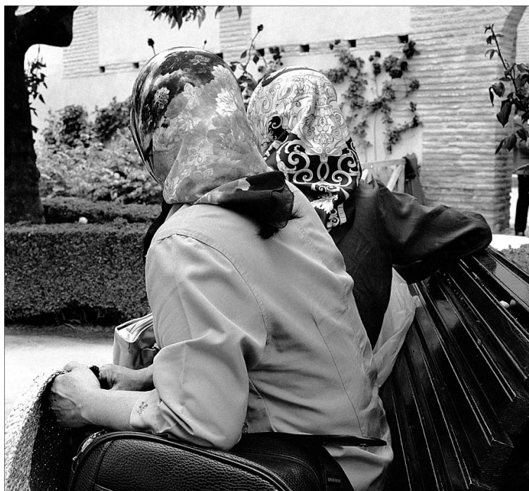
'Alhambra' forma parte de la muestra fotográfica de Maquieira.