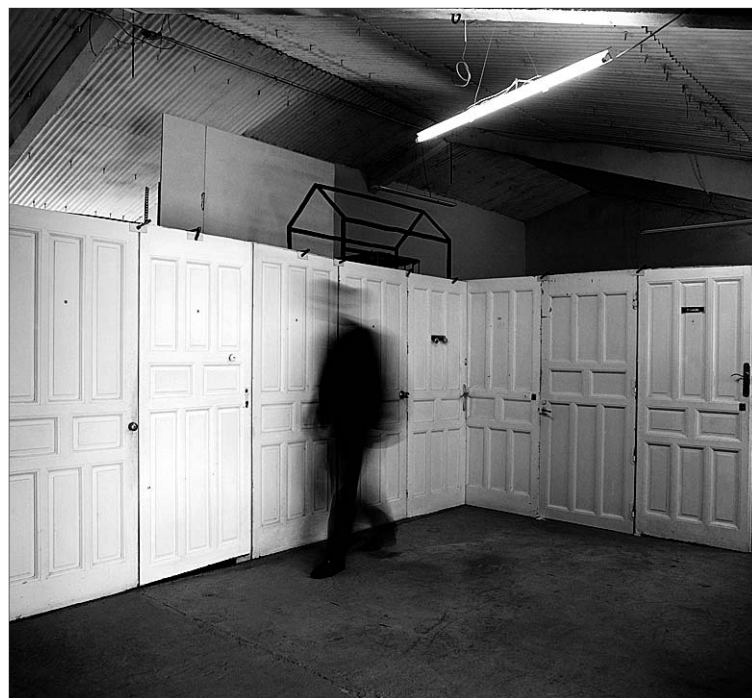
'Tormentas I', una de las esculturas que expondrá Florentino Díaz.