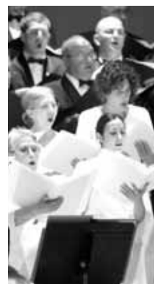
Actuación del coro.

En su agenda latinoamericana destaca la actuación (Réquiem de Verdi), junto con la Orquesta Sinfónica, el jueves en el Forum Universal de la Culturas en Monterrey. Cabe recordar que el proyecto Forum arrancó en Barcelona en 2004 con el objetivo de alcanzar un “compromiso ciudadano con el diálogo, la creatividad y el sentido común para un desarrollo justo,